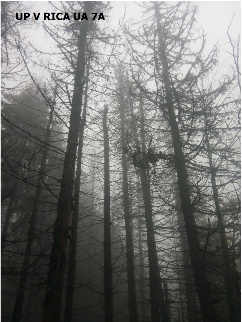
UP V RICA UA 7A