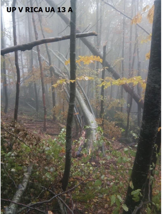
UP V RICA UA 13 A